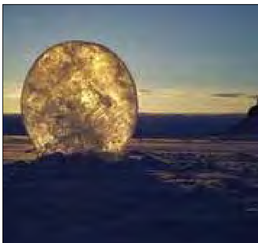
Figura 2. Lent de gel, Ackroyd i Harvey (2005)

“En Dan i jo vam esculpir un tros de gel glacial que vam serrar i transportar fora del mar glaçat fins a una gran lent en forma de disc. Teníem l’esperança que concentrés feixos de llum solar, i que potser desfaria la neu o socarrimaria fulls de paper. Doncs no va ser així, el sol era baix i feble però la lent glacial va esdevenir un atrapa-sol que presentava un mosaic de llum esberlat i antic. En Dan va fer una càmera fent servir una tallada de gel, col·locant-la darrera de la lent en un bloc de neu. La imatge del sol i les muntanyes llunyanes semblaven una aparició invertida en un full de gel glacial.” 10